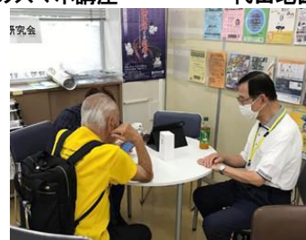
敬老週間スマホ相談会