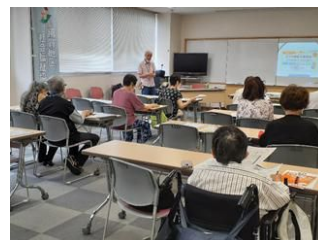
社協でのスマホ講座