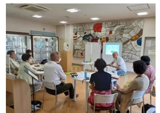
代田地区会館 IT カフェ